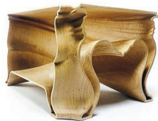
Jeroen Verhoeven, "Cinderella table", 2007. FOTO: COURTESY OF JEROEN VERHOEVEN