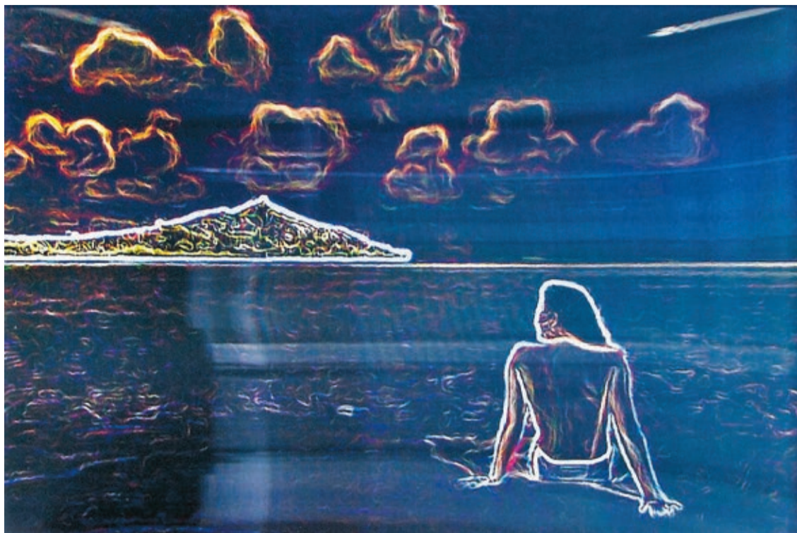
Constant Dullaart, "Glowing edges", 2014.